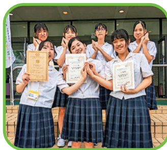
第7回SBP交流フェア ベネッセ賞・赤福賞受賞

原薬を動植物から取り出したり、合成したりします。錠剤や軟膏を作ってできあがりの確認をします。