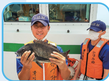
かづみの乗船実習