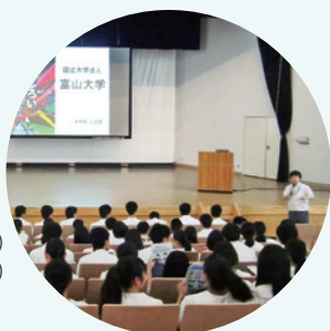
富山大学訪問2年(普通科)