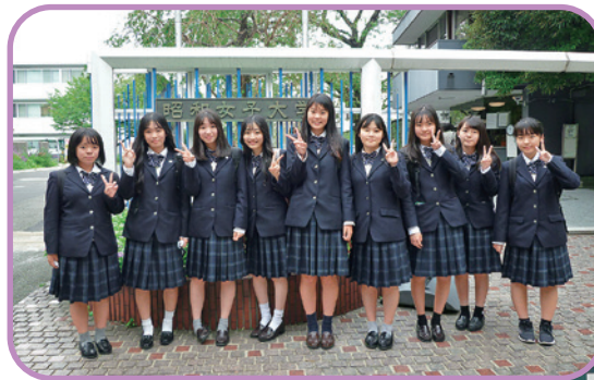
研修旅行 (大学訪問)

多様な文章等を多面的・多角的に理解し、創造的に思考して自分の考えを形成し、論理的に表現する力を育成します。また、言葉のもつ価値への認識を深め、言語感覚を磨き、言語文化の担い手としての能力の向上を目指します。