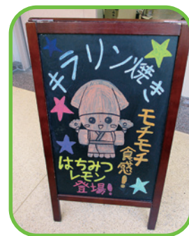
キラリン焼き看板