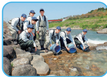
サクラマス放流実習

船のエンジンや各種機械類の原理・構造・運転・取り扱い等について基礎・基本を学び、エネルギーの有効活用(エコ運転)についての知識技術を学びます。