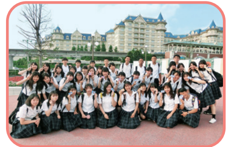
研修旅行 (ディズニーランド)