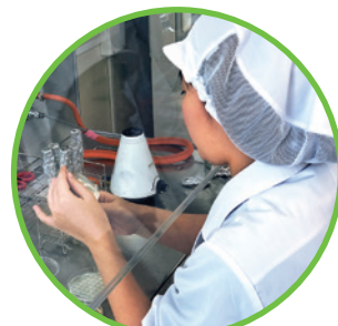
バイオテクノロジー実習