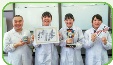
ミラコン2020最優秀賞受賞