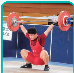
ウエイトリフティング部