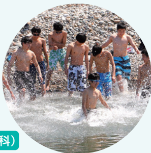
日本海開き(海洋科)