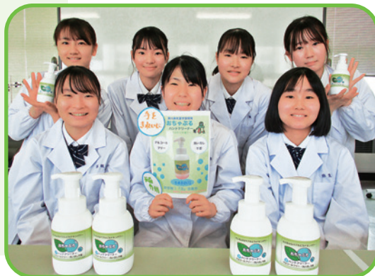
前田薬品工業株式会社との共同開発商品 泡消毒剤「おちゃぶる」の販売